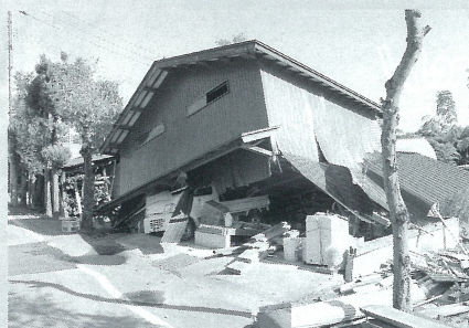
中越地震「小千谷市内の完全倒壊した車庫兼倉庫」