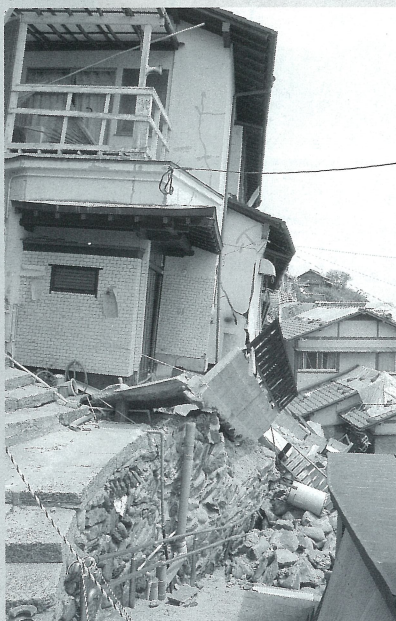
福岡県西方沖地震「地盤の崩壊によって大きな被害を受けた木造住宅」