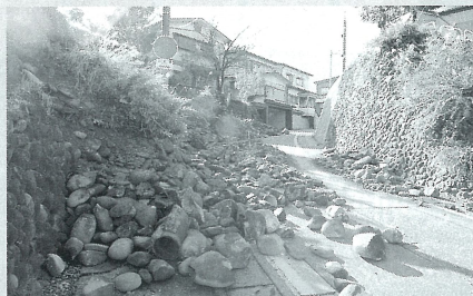
中越地震「小千谷市内の崩れた石垣」