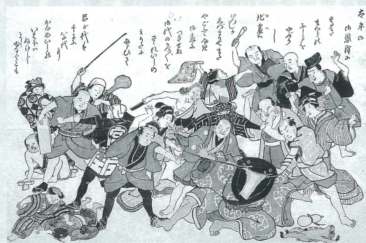
鯉絵「太平の御恩沢」