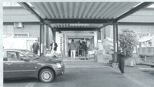
中越地震「十日町市災害対策本部(十日町市役所)」