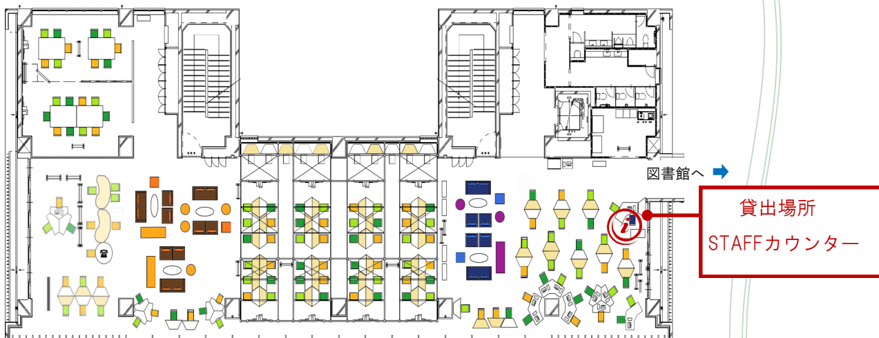
環境・情報科学館2階