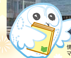
情報ライブラリーセンター マスコットキャラクター ブックロウ

新型コロナウイルス感染症への対応として、開館時間等一部運用を変更しています。最新の情報をホームページで確認してください。