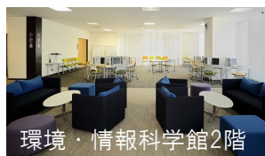
環境・情報科学館2階