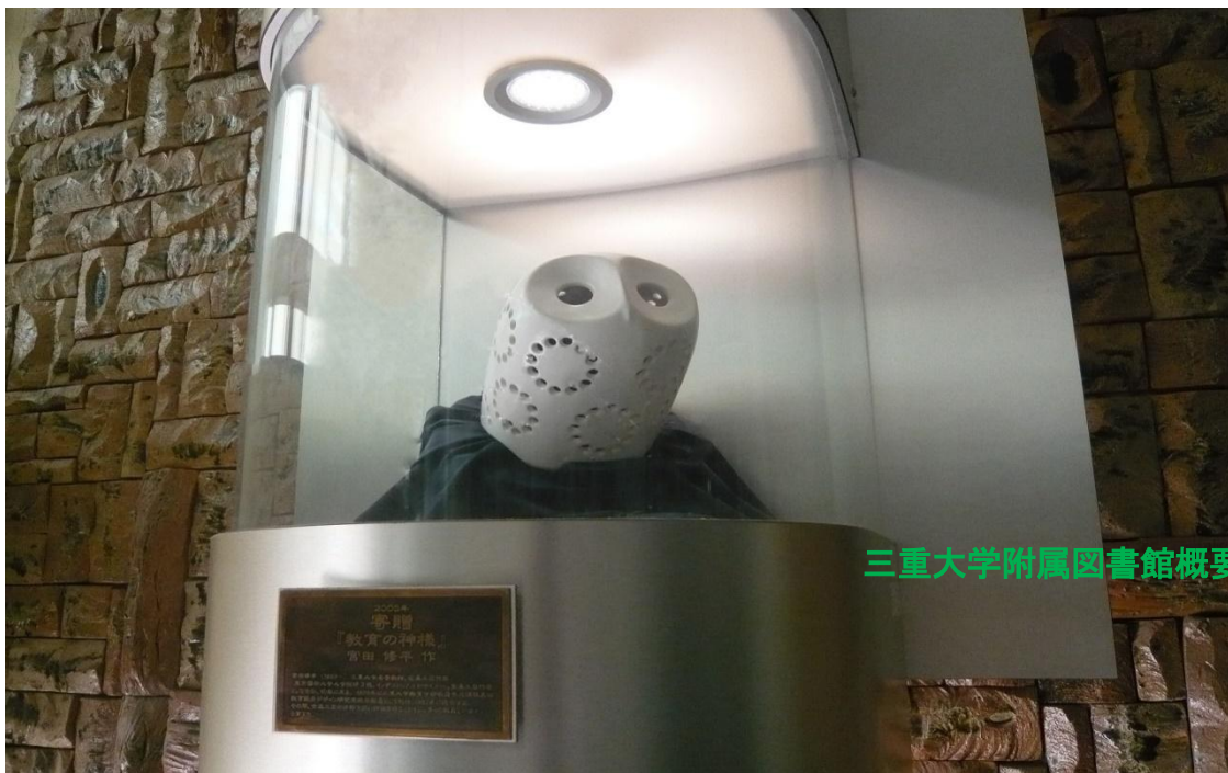
三重大学附属図書館概要 2025

三重大学附属図書館は、「研究支援機能」、「学習支援機能」、「地域貢献機能」の3つの機能をサービスの3本柱に据え、研究や学習に必要な学術情報を広く収集・提供しています。また、情報基盤センターと共に学内外のICT関連事業へのサポートのための情報窓口として機能しています。